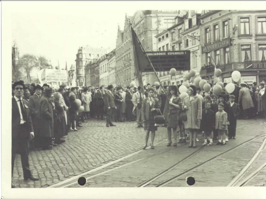
Manifestación por los detenidos en España, 7 de octubre de 1962. Bruselas.

La huelga va a coincidir con la solicitud realizada por el Régimen para ingresar en la Comunidad Económica Europea (CEE), lo que hará que la prensa europea multiplique la presencia de corresponsales. Una situación muy comprometida para el Régimen, que declarará el estado de excepción en Asturias, Vizcaya y Guipúzcoa, suspendiendo por tres meses el ejercicio de los derechos recogidos formalmente en el Fuero de los Españoles. Cerca de 400 trabajadores serán detenidos, proliferarán las palizas y torturas en comisaría. Más de un centenar de huelguistas serán deportados a provincias alejadas de las zonas de conflicto.