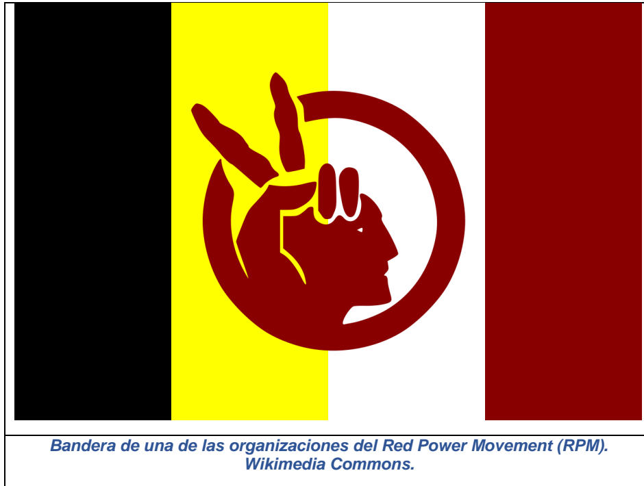
Bandera de una de las organizaciones del Red Power Movement (RPM).