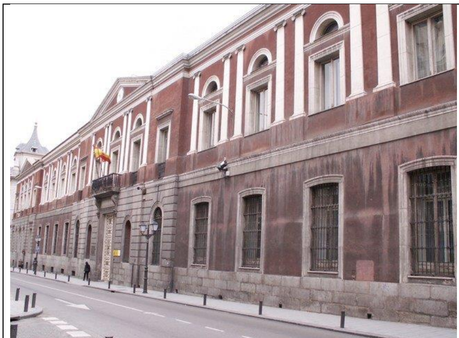
Sede de la Universidad de Madrid en 1956 en la calle de San Bernardo.

En ese momento, un joven Rodolfo Martín Villa, con tan solo 28 años, pero jefe nacional del SEU, diagnosticará en un informe «que la juventud se nos ha ido» porque no la hemos dejado disenter ni siquiera en lo circunstancial o puramente formal... Y según su balance se debe a que se les ha prometido la revolución de José Antonio y la revolución sigue estando pendiente en una sociedad aburguesada. El discurso nacionalsindicalista próximo al fascismo/nazismo parecería estar teñido de «izquierdismo formal» si no fuera porque sirve para amparar que se siga torturando a los detenidos antes de ser enviados a la cárcel por los tribunales militares, al equiparar la protesta estudiantil con la rebelión militar.